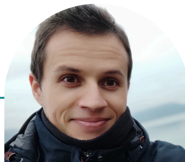
Directeur des Opérations